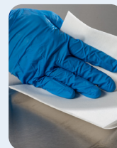
Lenços umedecidos sem fiapos