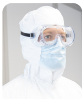
Óculos de proteção contra respingos químicos