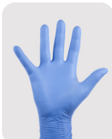
Luvas de borracha